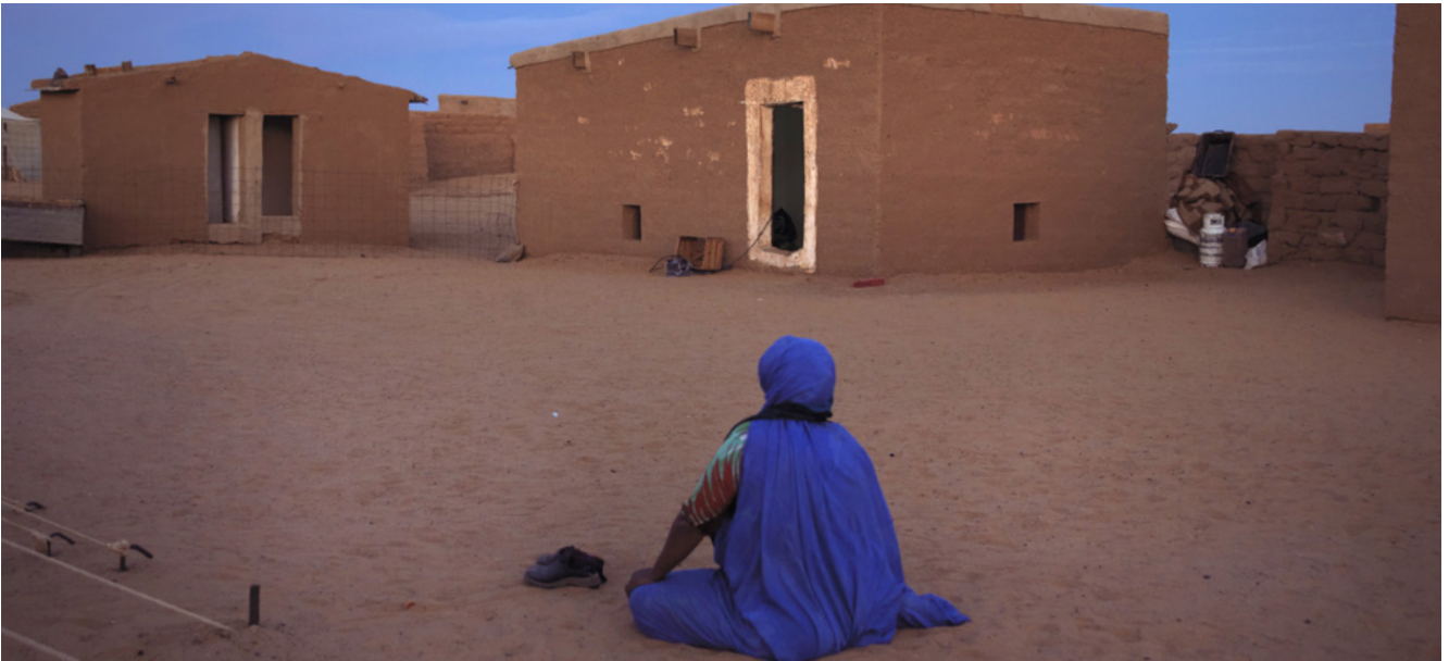
Mujer rezando junto a casas de adobe

En los campamentos hay toque de queda nocturno. Durante el festival podría haber alguna excepción en horarios de actividades nocturnas de FiSahara. Por favor presta atención y sigue todas las indicaciones relacionadas con la seguridad proporcionadas por la organización de FiSahara y tu familia anfitriona.