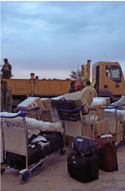
El aeropuerto de Tinduf.

El personal de la aerolínea tendrá el listado de viajeros y viajeras en la facturación. Allí mismo os haremos entrega del catálogo del festival.