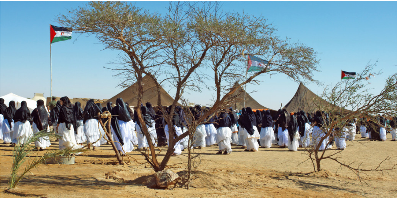
Mujeres saharauis vestidas con el traje tradicional.

El momento de la despedida de las familias suele ser uno de los más emotivos del festival; durante una semana su jaima se habrá convertido en nuestro hogar y para ella ya seremos un miembro más.