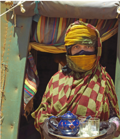
Mujer ofreciendo té

Para quien ya ha estado en FiSahara y le preguntan lo que más le ha gustado del festival, una gran parte no duda en responder: su familia saharauí. Nada más llegar al campamento, las madres de familia se acercan para dar la bienvenida a sus huéspedes, invitarles a sus jaimas y brindarles su famosa hospitalidad alrededor de tres vasos de té saharauí. Las familias se ocupan de ofrecer tres comidas diarias y velarán por el bienestar de sus huéspedes; os acompañarán a la zona de actividades del festival, de regreso a la jaima, etc. Durante esos días, muchxs visitantes desarrollan lazos con su familia saharauí que perduran mucho más allá del festival.