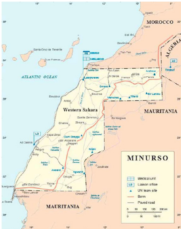
Mapa de la MINURSO con las fronteras del Sáhara Occidental, Argelia, Marruecos y Mauritania.

FiSahara se celebra en los campamentos de población refugiada saharauí en el corazón del desierto del Sáhara, cerca de la ciudad argelina de Tinduf. Hasta allí huyeron miles de saharauis en 1975 cuando su tierra, el Sáhara Occidental, fue invadida por Marruecos y Mauritania con el beneplácito de España, la potencia colonial. Desde entonces, el Sáhara Occidental está pendiente de su descolonización, un proceso estancado durante décadas en las Naciones Unidas, y el pueblo saharauí permanece en el exilio o en su tierra bajo ocupación marroquí.