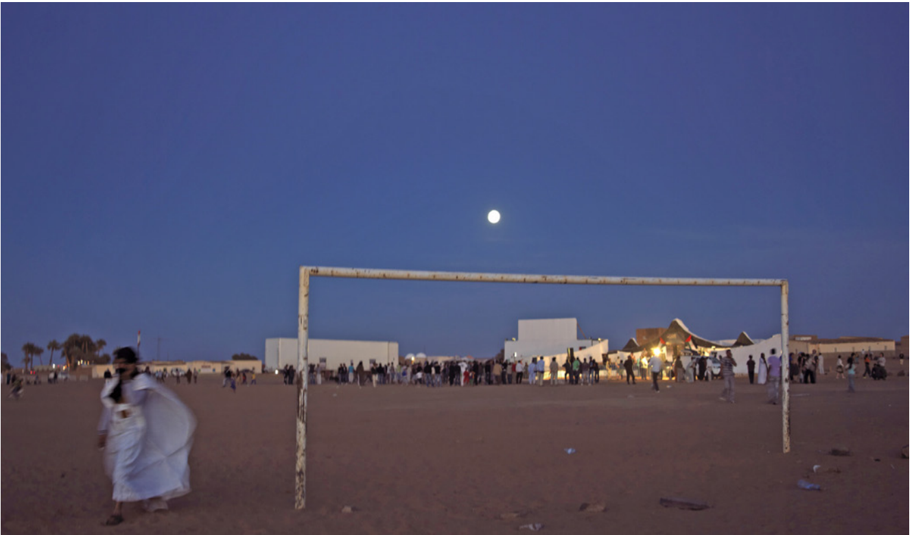
Alrededores del Festival

Las jaimas en las que nos alojamos estarán situadas lo más cerca posible al recinto del festival. El acceso es gratuito tanto para saharauis como para visitantes de otros países. Se podrá caminar a casi todas las actividades — proyecciones, charlas, ceremonias, el campamento de cultura tradicional, etc. Os animamos que disfrutéis del festival con vuestra familia saharauí; recorrer juntxs las jaimas del campamento cultural (LeFrig) os ayudará comprender mejor las diferentes tradiciones mostradas por las mujeres, y ver una película bajo las estrellas junto con tu familia puede convertirse en uno de los recuerdos más mágicos del festival.